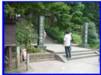
円覚寺 ：鎌倉五山第2位。約6万坪 の広い境内に15の塔頭寺院が建つ。 参拝時間 8:00～17:00(4～10月) 8:00～16:00(11～3月) 拝観料300円。