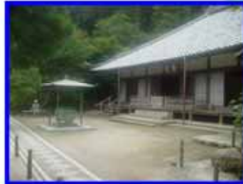
明月院 ：境内に多くのアザサイが植え られている。参拝時間9:00～16:00 8:30～17:00(6月) 拝観料300円。