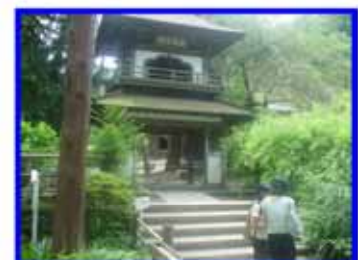
浄智寺 ：鎌倉五山第4位。現在の 建物は関東大震災後に再建された。 参拝時間9:00～16:00 拝観料200円。