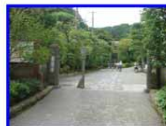
東慶寺 ：弘安8年北条時宗の妻、 覚山尼創建。参拝時間：8:30～17:00 8:30～16:00(11～2月) 拝観料100円。