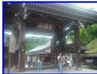
建長寺 ：建長5年に北条時頼創設。 日本最初の禅の専門道場。参拝時間 8:00～16:30 拝観料300円。